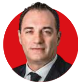
Muss aufräumen: Seit Ende Juni ist Antonio Filosa Chef von Stellantis

Abserviert: Stellantis-CEO Carlos Tavares wurde von Elkann im Dezember 2024 verabschiedet