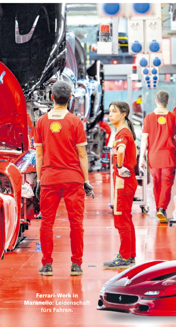
Ferrari-Werk in Maranello: Leidenschaft fürs Fahren.